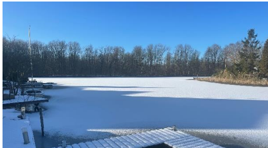
HET WAS WEER VOLOP GENIETEN VAN HET WINTERSE UITZICHT

Mocht u hierop willen reageren, ga dan naar onze website: www.meerwijck.com .