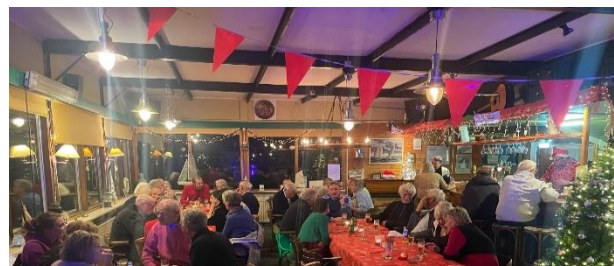
HET WAS GEZELLIG OP DE TRADITIONELE VBM KERSTBORREL

Voor zij die deze bijeenkomst gemist hebben bij deze van het bestuur ook een gelukkig en gezond 2024!